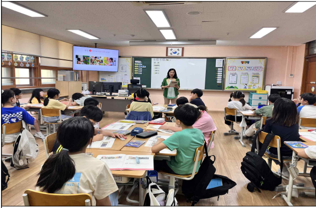
찾아가는 아동권리 교육(아동)