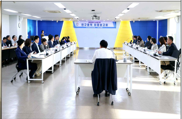
아동친화도시 조성 연구용역 최종보고회