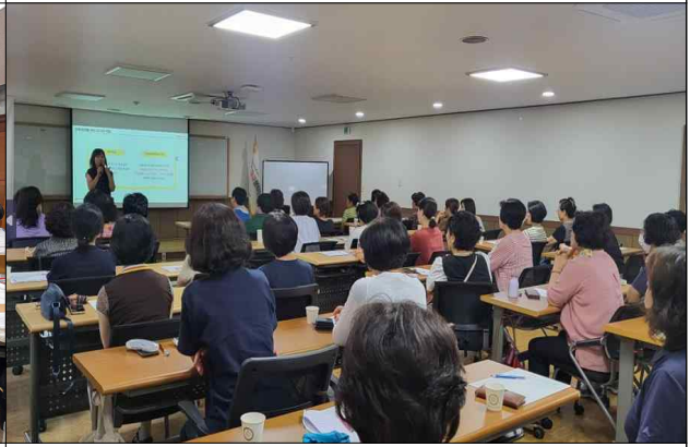
찾아가는 아동권리 교육(중사자)