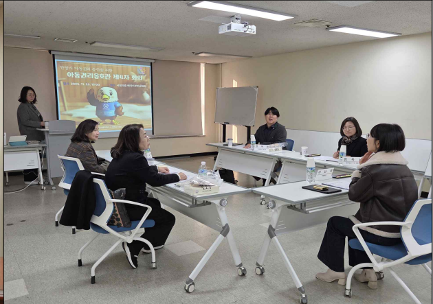
아동권리옹호관 제4차 정기회의