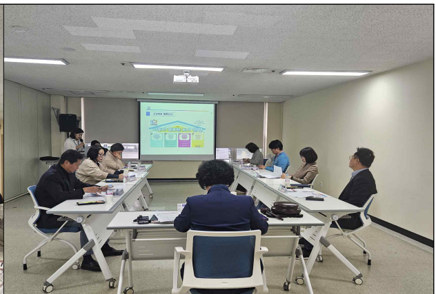
아동친화도시 추진위원회 심의