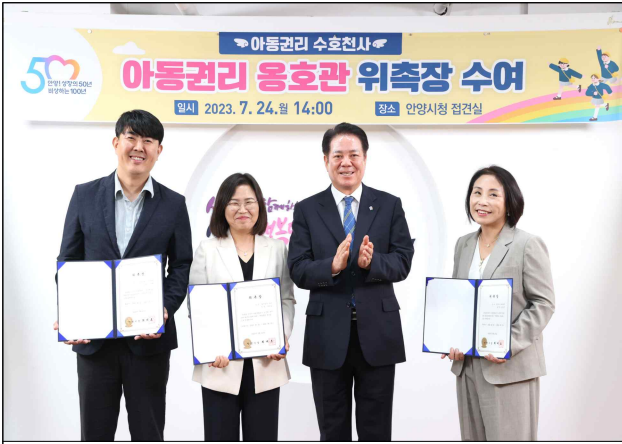
아동권리옹호관 위촉장 수여