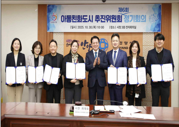
추진위원회 위촉 및 6회 정기회의