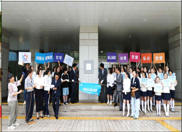
아동친화도시 인증 현판식