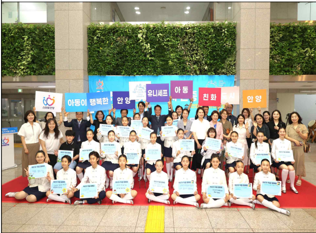
아동친화도시 인증 선포식