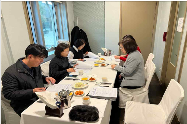
2024년 아동권리옹호관 회의