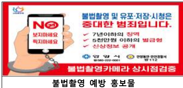
불법촬영 예방 홍보물