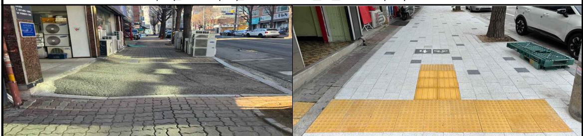
수리산로(만안로 ~ 냉천로)