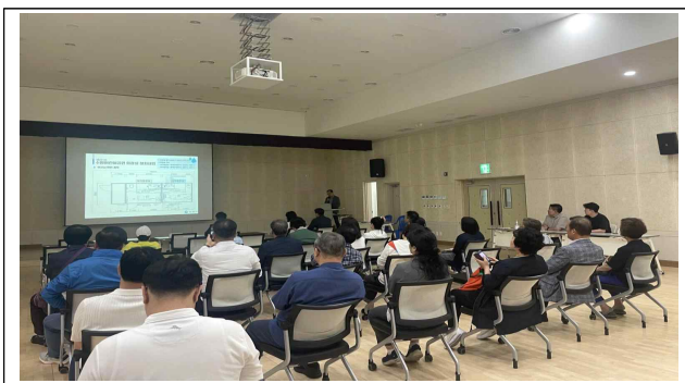
2023. 5. 31. 비산1동 주민설명회 개최