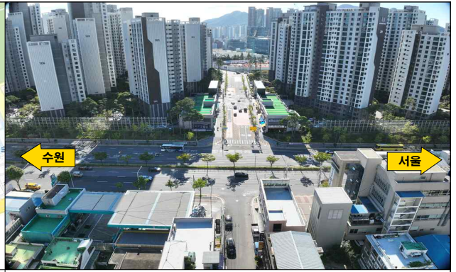
현 장 사 진