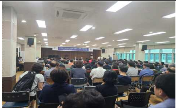
주민간담회 및 면담 실시