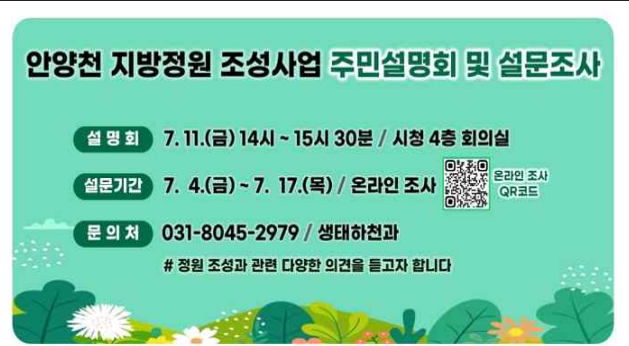
안양천 지방정원 조성사업 설문조사