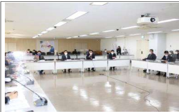
중간보고회 민간전문가 자문