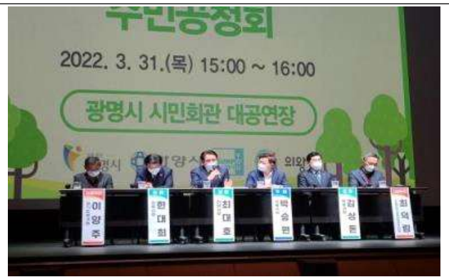
주민공청회 전문가 토론 및 주민 의견 청취