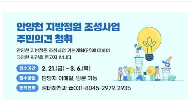
기본계획(안) 홈페이지 의견청취