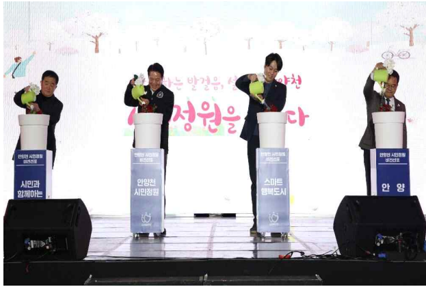
안양천 시민정원 비전선포식