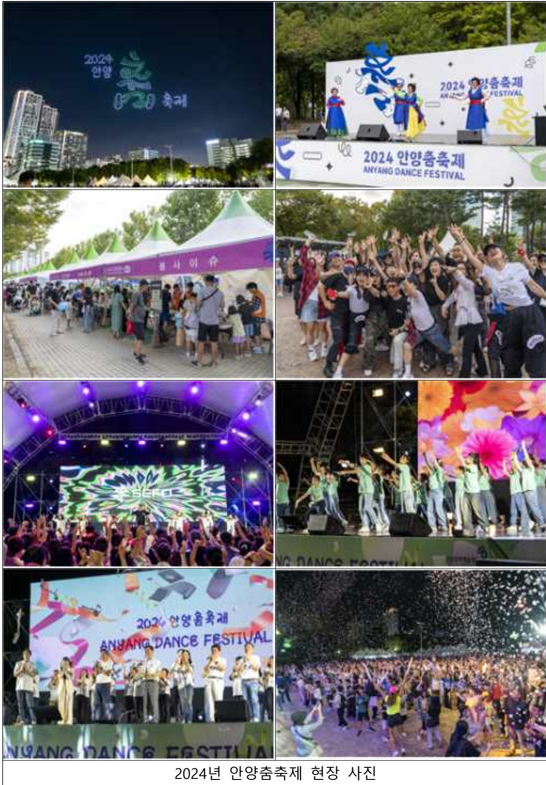
2024년 안양춤축제 현장 사진