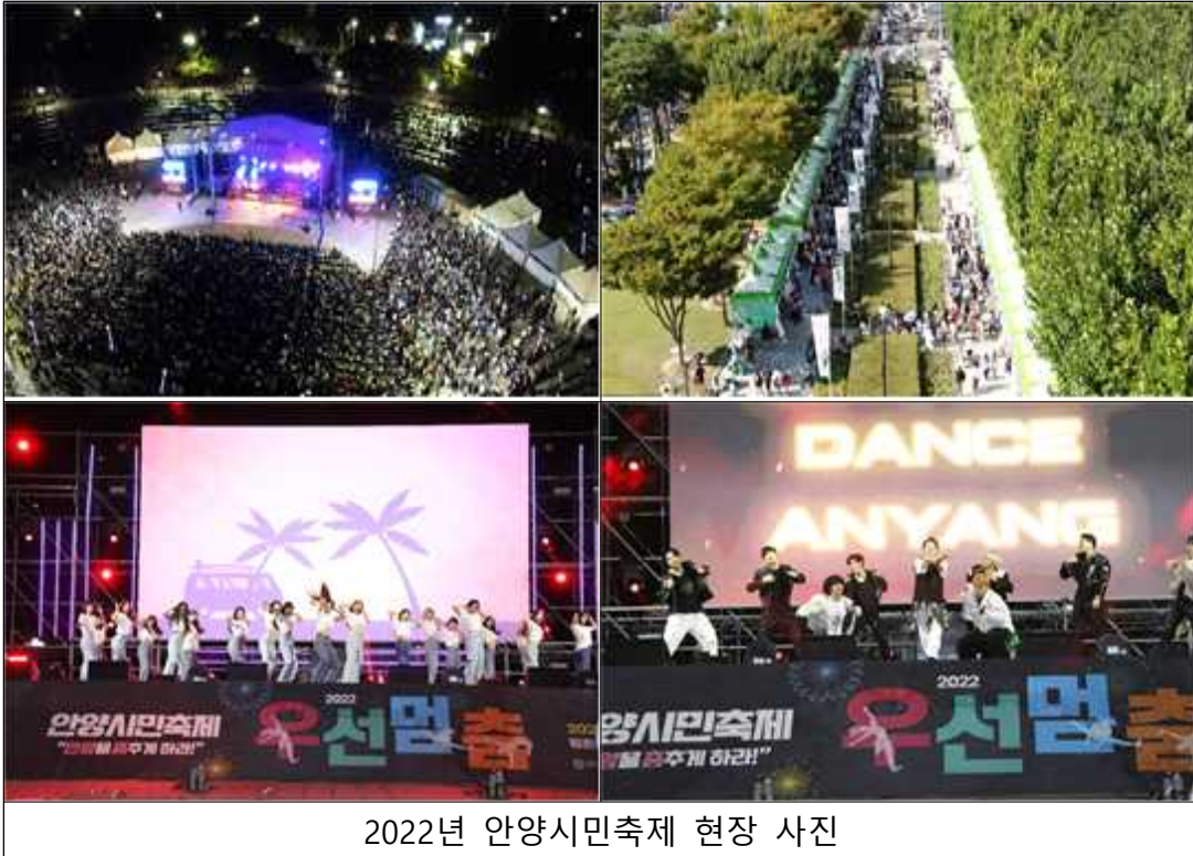
2022년 안양시민축제 현장 사진