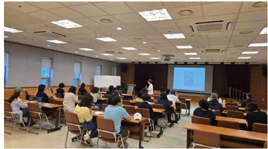
안양대학교 시리즈 인문강좌