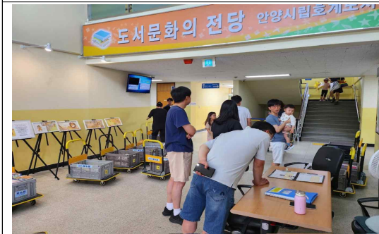
전집도서 대출서비스 「북수레」