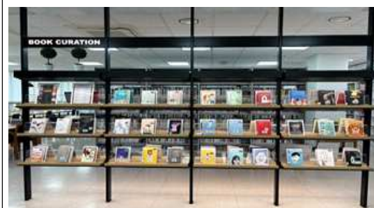
북큐레이션 「책의 재발견」