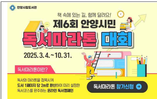
2025 독서마라톤 홍보자료