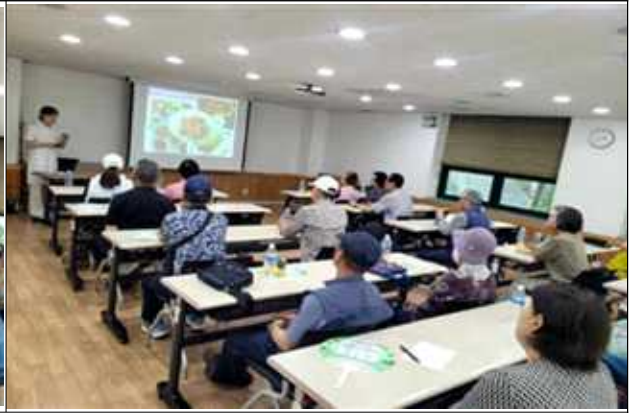
<2025년 6월, 고혈압 및 고지혈증 예방교육 시행>