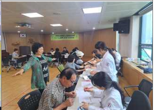
<2025년 9월, 인센티브 지급 및 사후 스크리닝 실시>