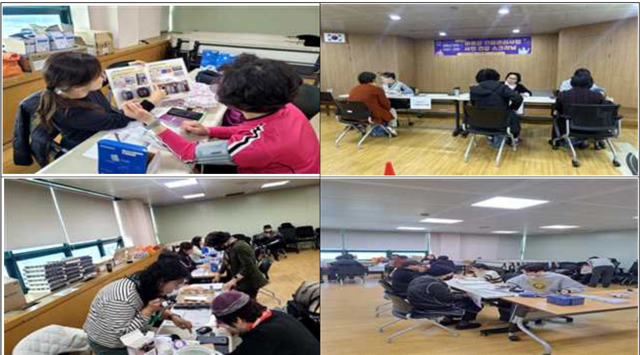
<2025년 3월, 사전 스크리닝 시행>