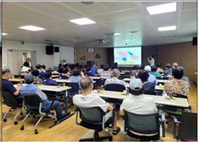
<2025년 9월, 어르신 구강 교육 시행>