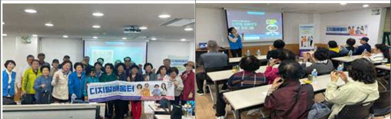
<2025년 5월, 어르신 맞춤형 ICT 교육 시행>